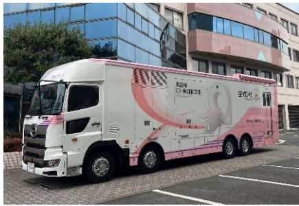
巡回健診で県内全域をカバー

同支部は、今後も過疎地域や県内老人保健施設等の高齢者、障がい者を含め、県民にきめ細かな同一基準の健診機会を提供していくことで、地域の活力増進の一助となることを目指します。